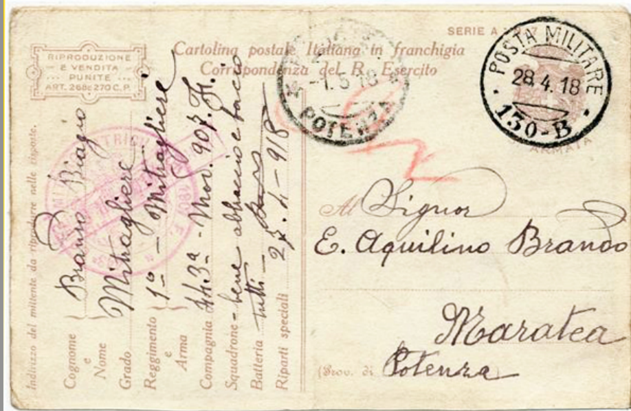
Cartolina in Franchigia spedita il 28 aprile 1918