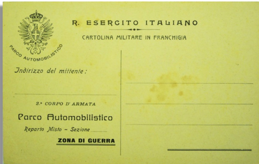
Cartolina in Franchigia del II Corpo d'Armata