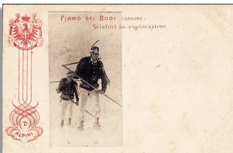
"Piano dei Buoi" in zona passo della Sentinella (Cadore)